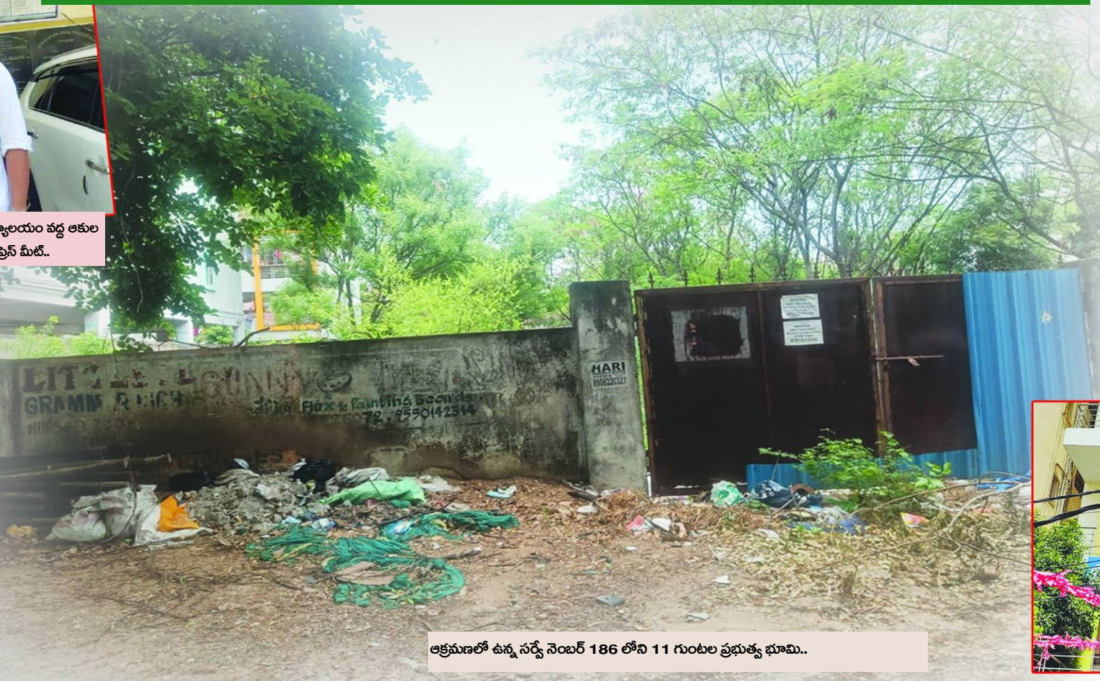
అక్రమణలో ఉన్న సర్వే నెంబర్ 186 లోని 11 గుంటల ప్రభుత్వ భూమి..