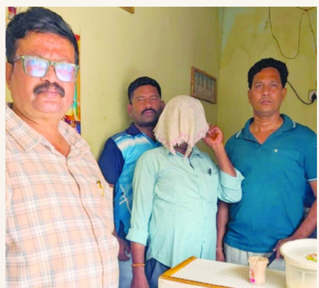
గిద్దలూరు పెన్ పవర్ జూన్ 21