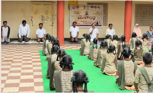
సి ఎస్ పురం, పెన్ పవర్ జూన్ 21