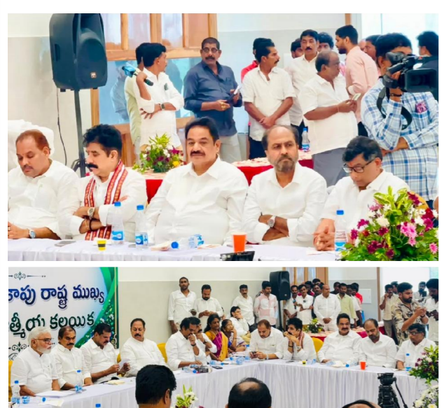
సి ఎస్ పురం, పెన్ పవర్ జూన్ 21