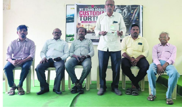
క్రైమ్ రిపోర్ట్ పెన్ పవర్, ఒంగోలు జూన్ 21

ఆంధ్రప్రదేశ్ లో పోలీస్ లాకప్ లలో జరుగుతున్న హింసపై విచారణ కమిషన్ వేసి సంబంధిత అధికారులకు పై చట్టపరమైన శిక్షలు విధించాలని పలు ప్రజా సంఘాలు, న్యాయవాదులు డిమాండ్ చేశారు. ఈ మేరకు ఇండియన్ లీగల్ ప్రాఫెషనల్ అసోసియేషన్ (ఐ ఎల్ పి ఏ) ఆధ్వర్యంలో ఒంగోలు ఎంసీపీ భవనంలో రౌండ్ టేబుల్ సమావేశం నిర్వహించారు. ఈ సమావేశానికి న్యాయవాది, ఇండియన్ లీగల్