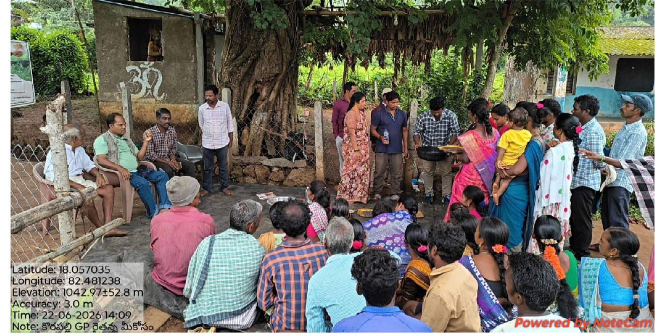
Latitude: 18.057035 Longitude: 82.481238 Elevation: 1042.97±52.8 m Accuracy: 3.0 m Time: 22-06-2026 14:09 Note: కొరపల్లి GP రైతున్న మీకోసం