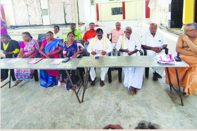
సింగరాయకొండ, జుగుమల్లి జూన్ 22, పెన్ పవర్

ధర్మకర్తల మండలి చైర్మన్ సన్నెబోయిన శ్రీనివాసులు నాయుడు, ఇ ఒ కృష్ణ వేణి పిలుపు